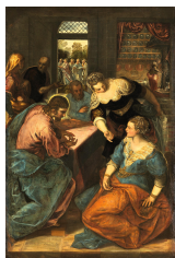
Gemälde von Jacopo Tintoretto

Samstag, 7. März 2026 Atempause für Frauen – Einkehrtag in Weiltingen